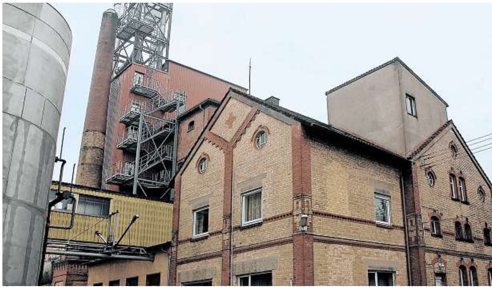
Nichts geht mehr, zumindest vorläufig: Die Hans Wiessner GmbH in Eppingen-Richen hat die Maschinen angehalten.