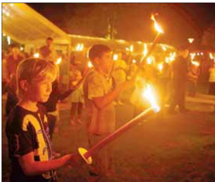
Brennende Fackeln gehören zum Flair der neuen Mühlbacher Familien-Veranstaltung „Kunst begegnet Musik“.